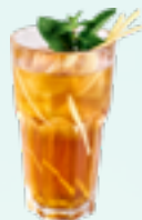
MINZE INGWER EISTEE