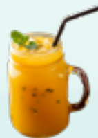
MANGO MARACUJA LIMONADE